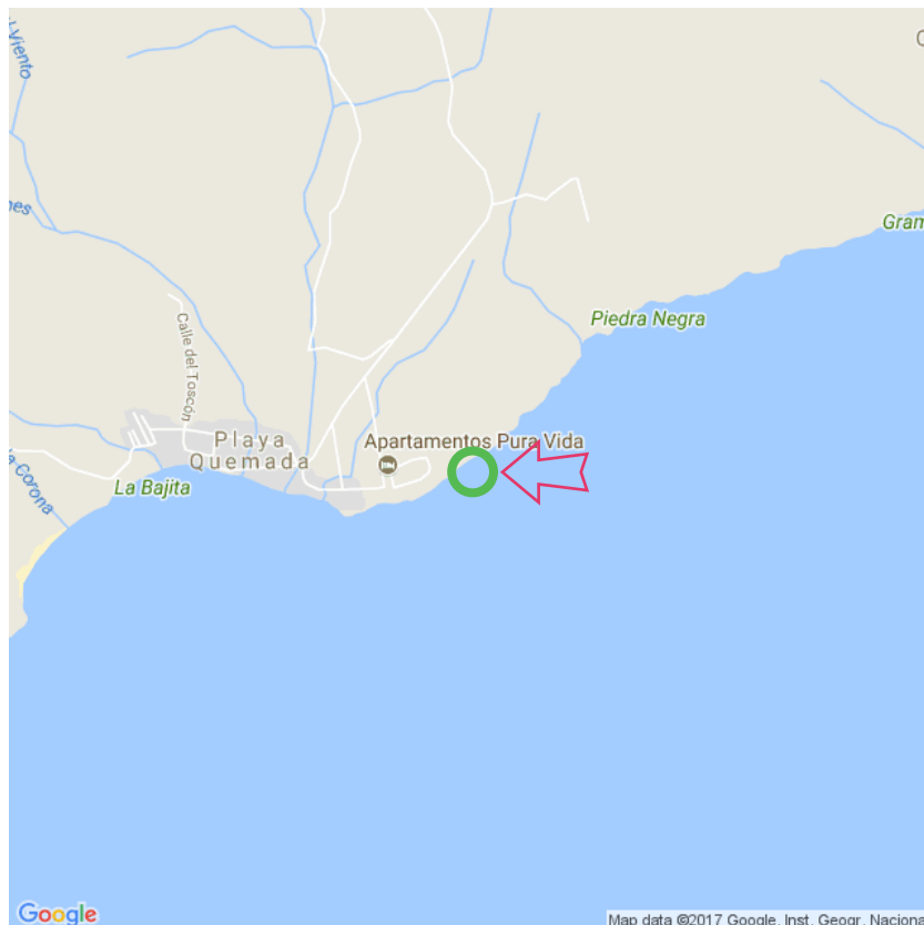
Playa Quemada Beach (18-10-2017)