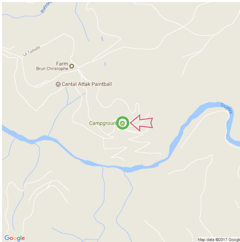
La Taillade (15-12-2017)