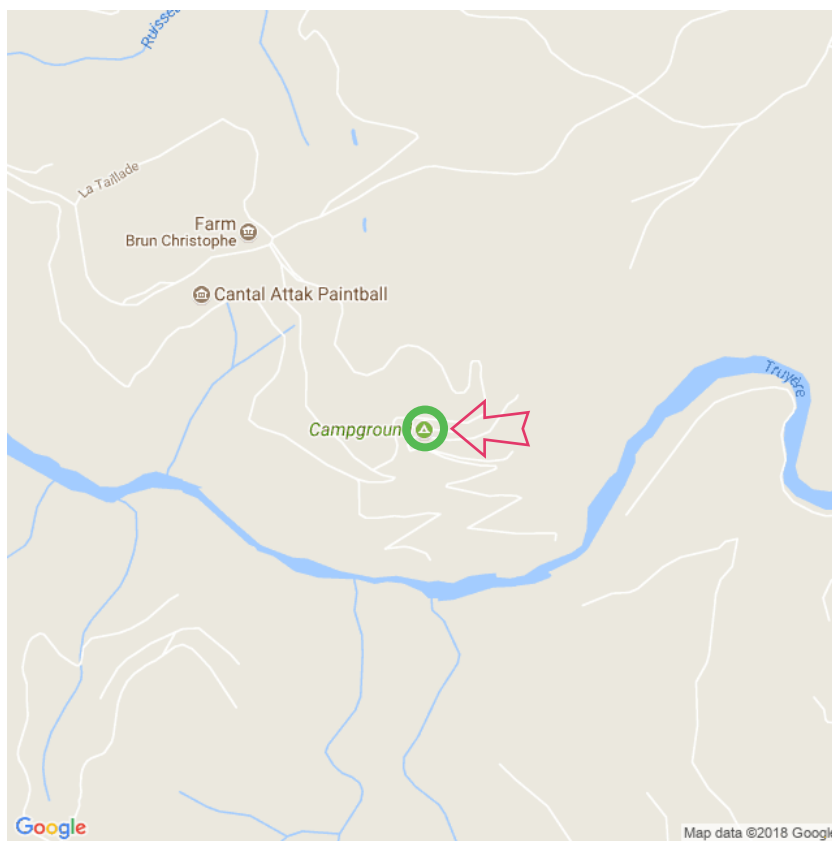
La Taillade (19-06-2018)