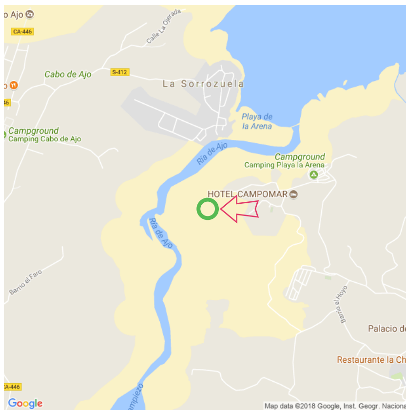
Playa La Arena / Los Nudistas (16-07-2018)