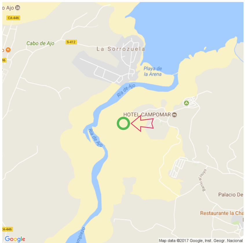
Playa La Arena / Los Nudistas (20-09-2017)