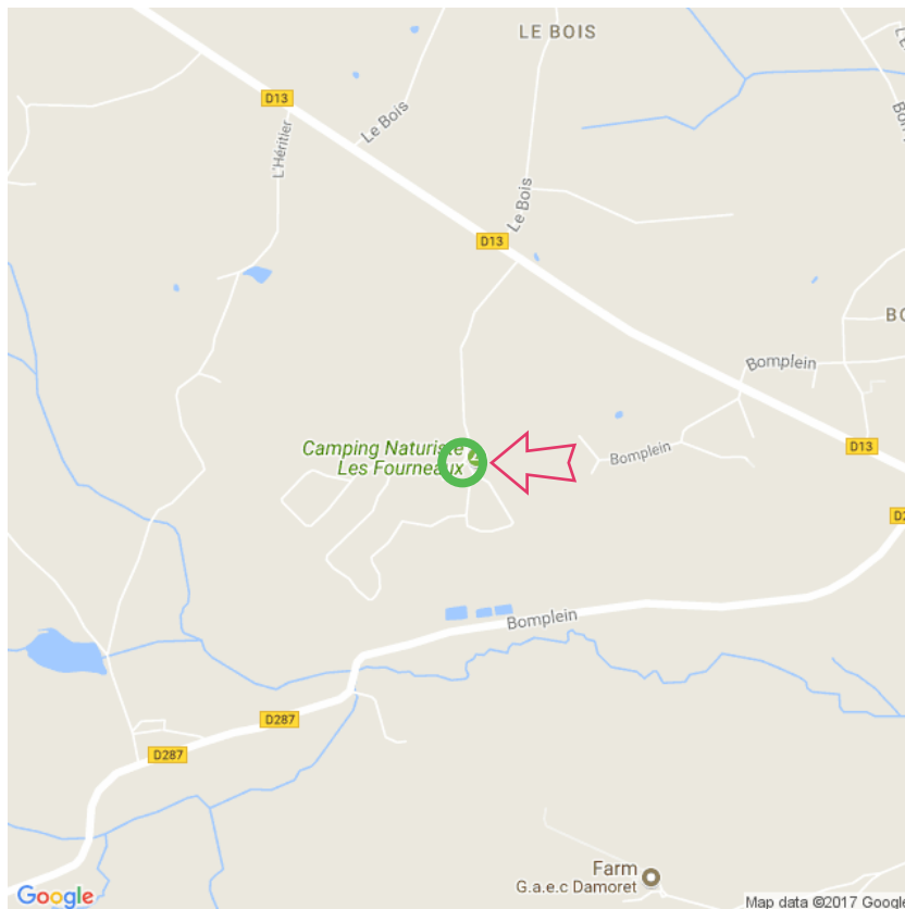
Les Fourneaux (16-12-2017)