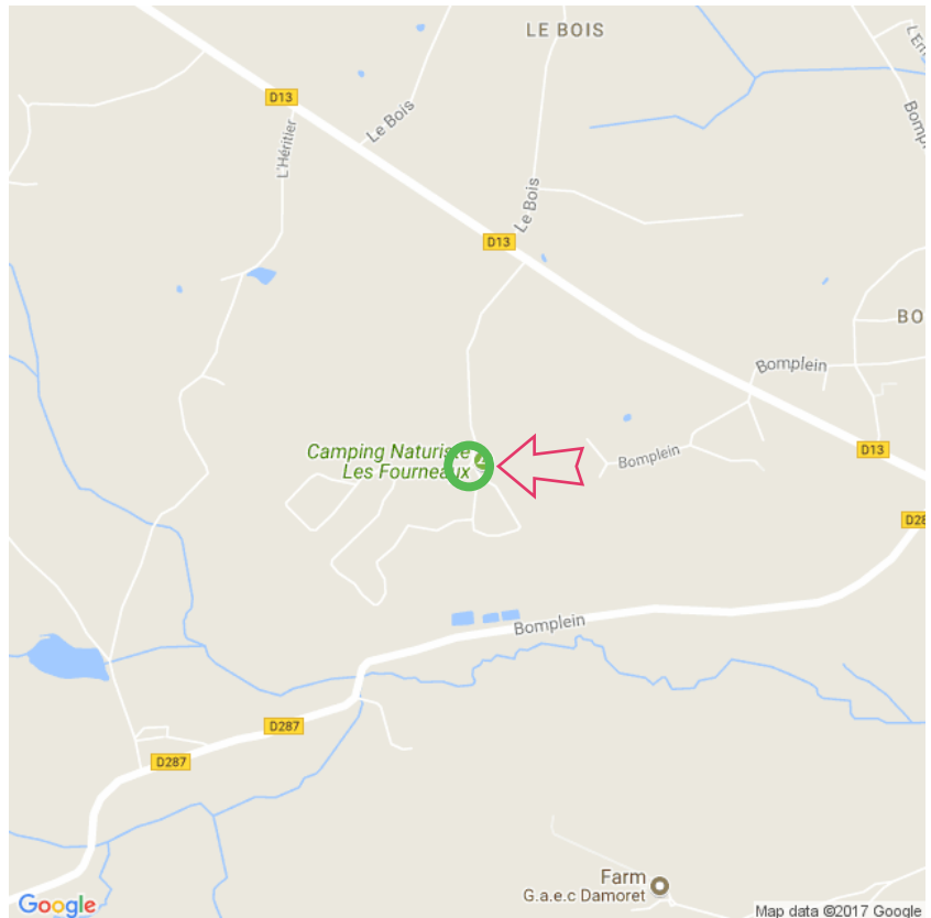
Camping Naturiste Les Fourneaux (19-10-2017)