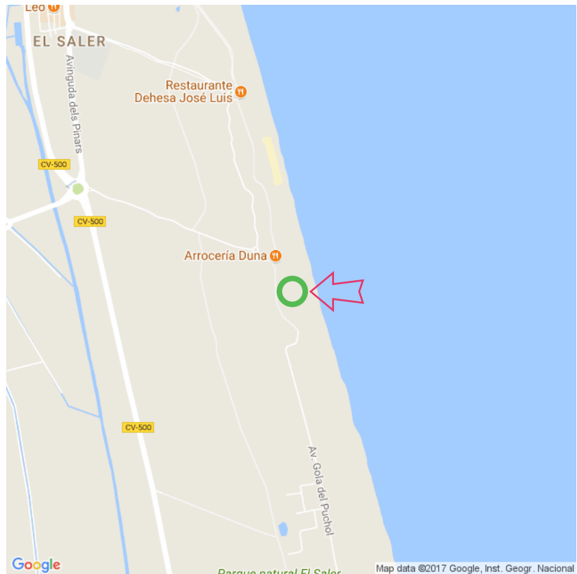
El Saler - net ten zuiden van de stad Valencia (18-01-2018)