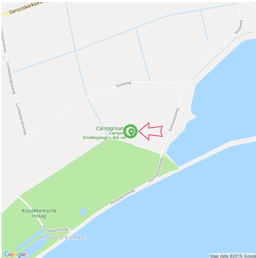
Smallegange's Dijk (20-07-2018)