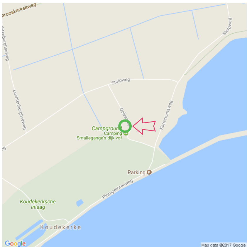
Smallegange's Dijk (16-12-2017)