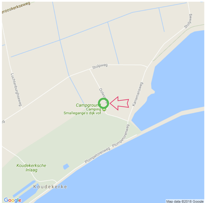
Smallegange's Dijk (22-03-2018)