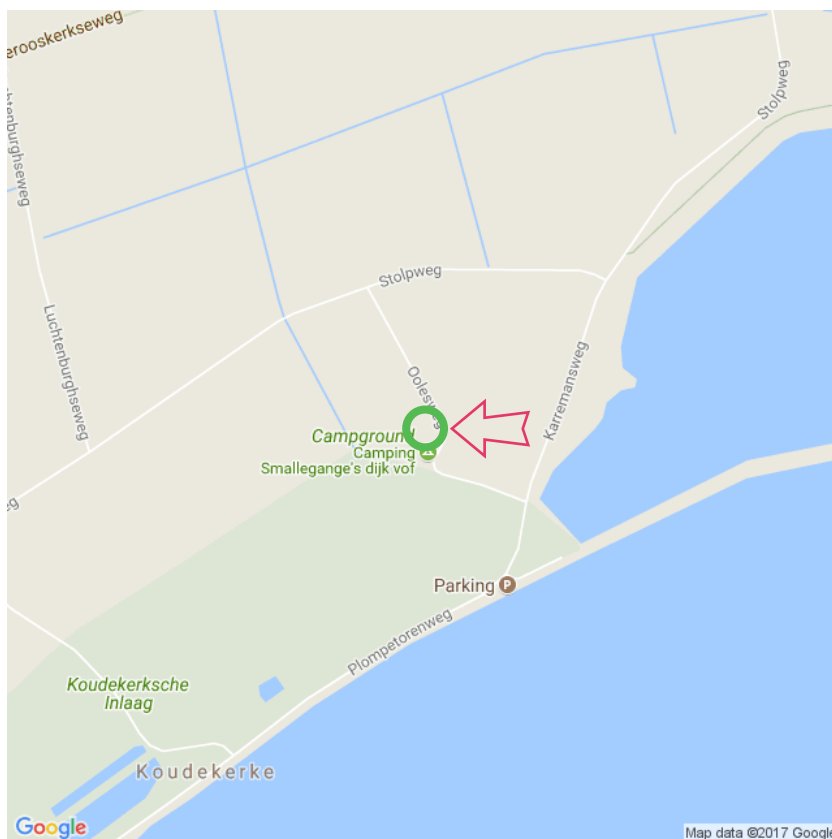
Smallegange's Dijk (20-11-2017)