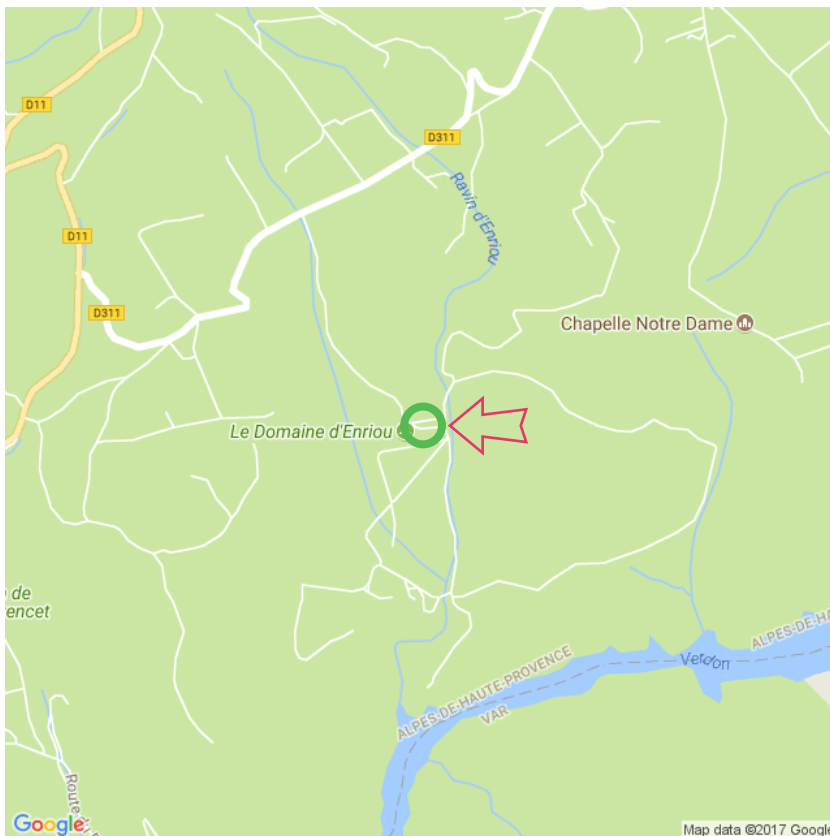
Domaine d'Enriou (17-08-2017)