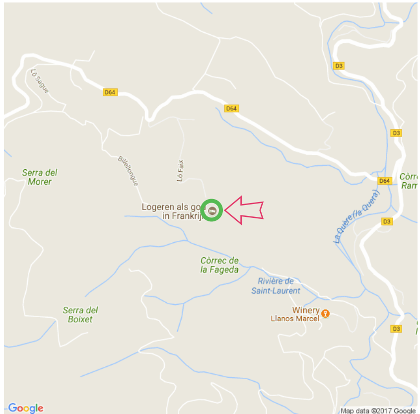
Blotgewoon, Domaine el Faig (20-10-2017)