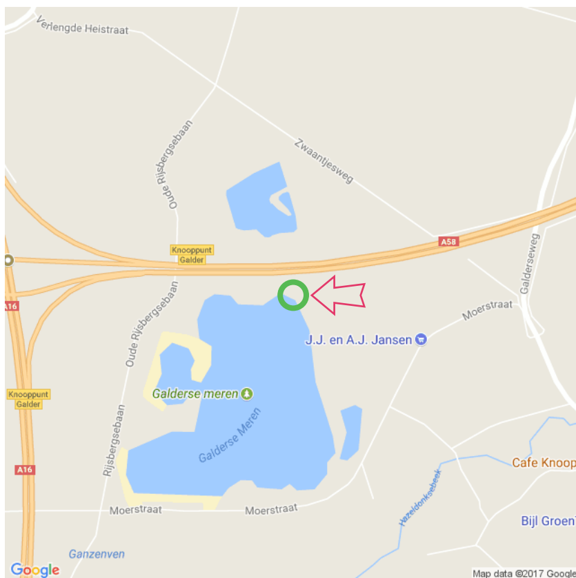
Galderse Meren (19-11-2017)