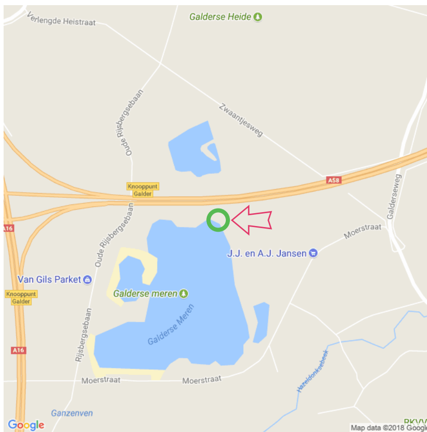
Galderse Meren (19-03-2018)