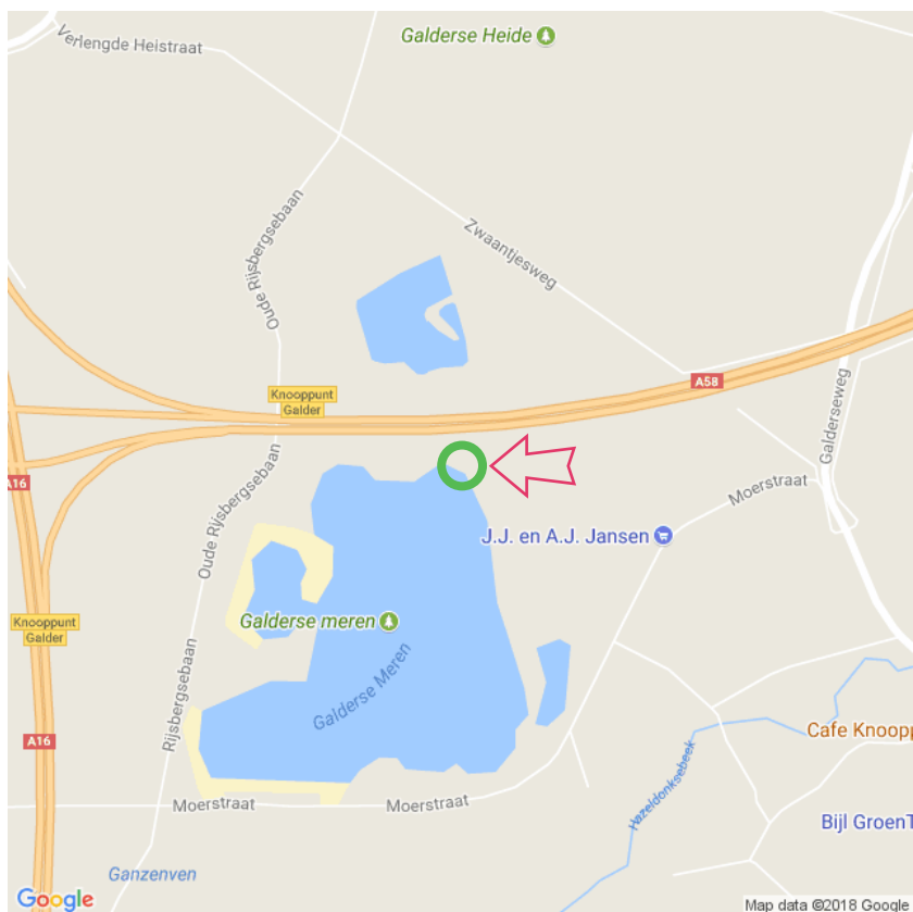
Galderse Meren (19-01-2018)