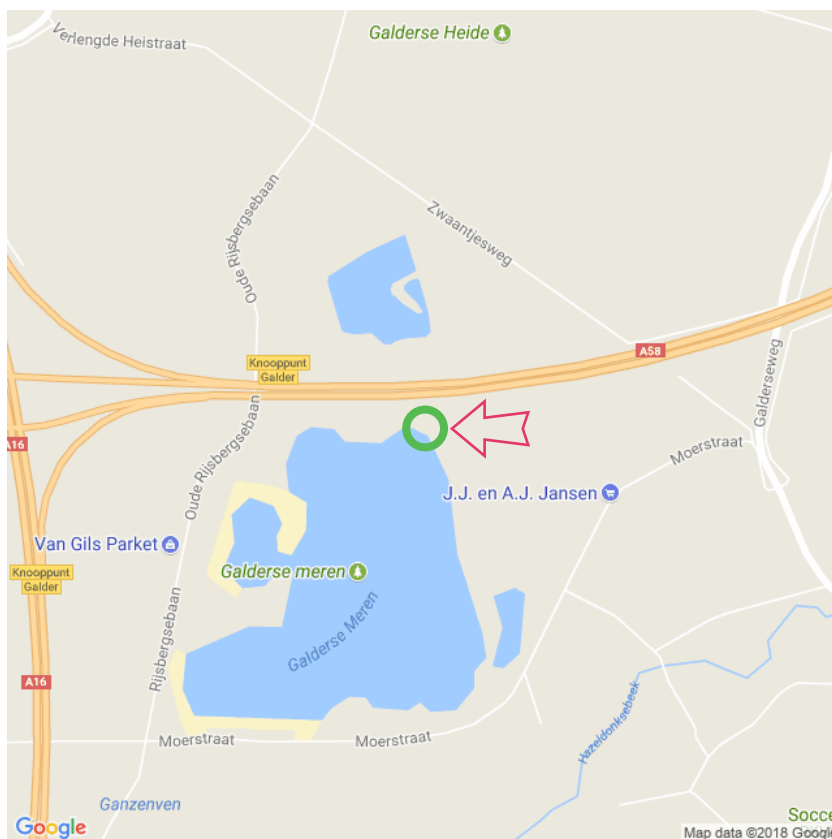
Galderse Meren (22-06-2018)