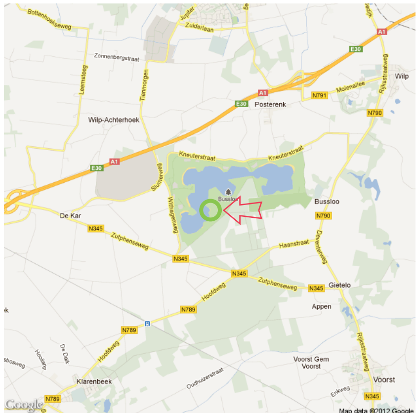
Naaktstrand Bussloo (23-05-2012)