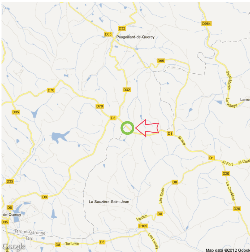
Centre Naturiste Le Fiscalou (23-05-2012)