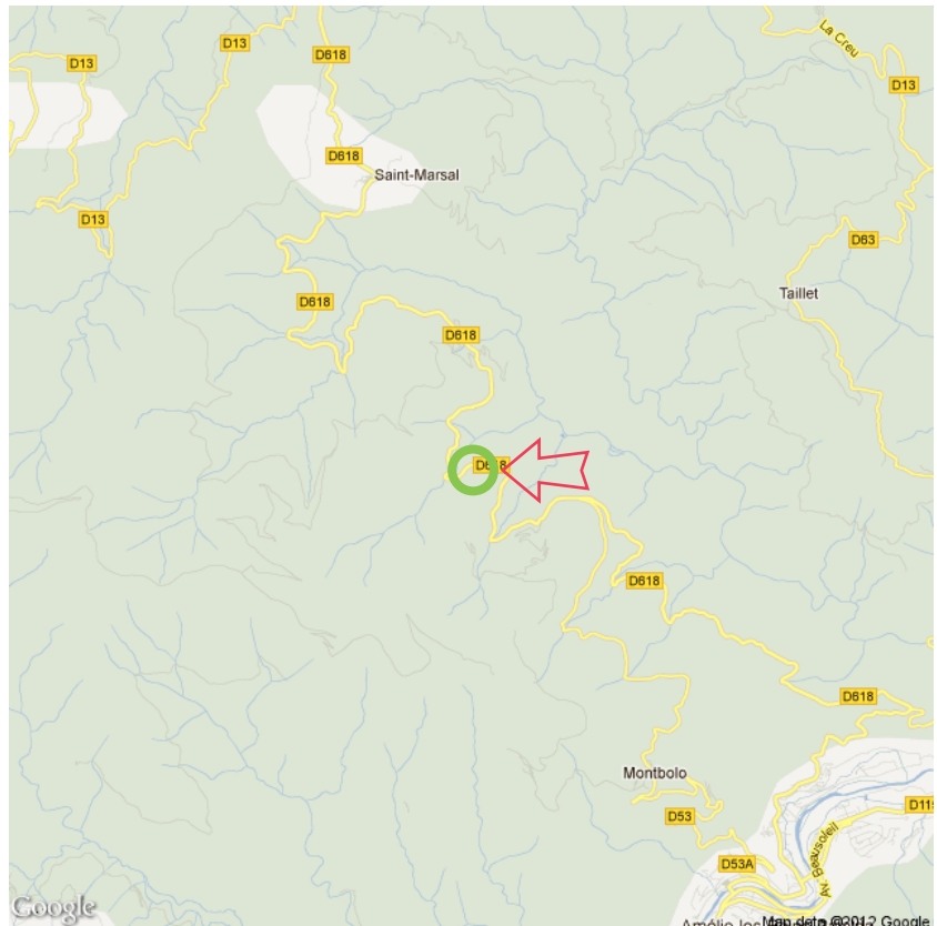
Mas de la Balma (23-05-2012)