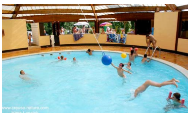
www.creuse-nature.com Hans Lensink