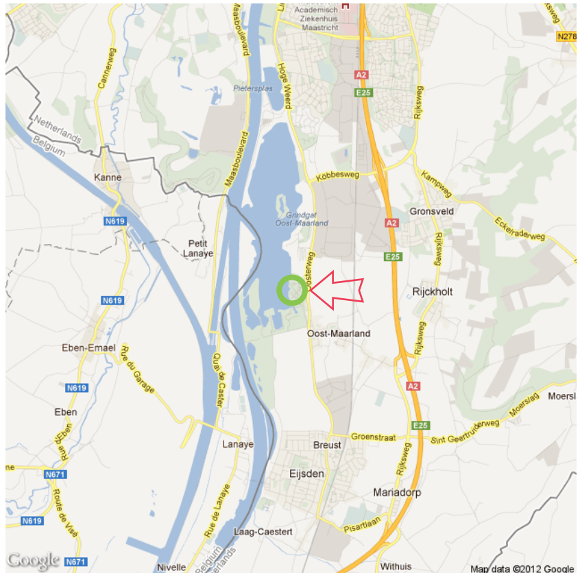
Fun Valley (was Dagstrand Oost-Maarland) (22-05-2012)